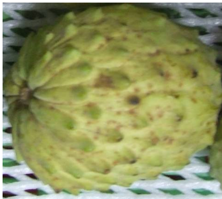
תמונה 1: נקודות חומות בקליפת הפרי

בעת בחינת איכות הפרי בתום האחסון בקירור ולאחר חיי המדף, נמצאו הבדלים מהותיים בין המטעים הדרומיים (גן שומרון ובנימינה) לכברי. הבדלים אלו עשויים לנבוע לכאורה מהבדל באזורי הגידול, אך סביר יותר להניח כי הינם נובעים ממצב ההבשלה השונה של הפרי, לאור העובדה כי בניסויי עבר, פרי מאזור הגליל המערבי, שאוחסן במשך 4 שבועות היה רגיש מאוד להתפתחות ריקבנות, להבדיל מתוצאות השנה (מחקרי אחסון אנונה 2005). לפיכך, נערך ניתוח סטטיסטי נפרד לפרי מהמטעים הדרומיים (4 חזרות לטיפול) ולפרי מכברי (2 חזרות לטיפול). איכות הפרי נבחנה לראשונה לאחר שבועיים באחסון, אך לא נמצאו ריקבנות כלל. לכן הוארך האחסון בשבועיים נוספים שאפשרו התפתחות ריקבנות. בבחינת איכות הפרי מהמטעים הדרומיים בתום האחסון בקירור נמצאו שיעורי ריקבון בעיקר בקשקשים ובצידי הפרי, ללא השפעה של טיפולי ההדברה (טבלה 1). אולם, לאחר חיי המדף עלה שיעור הריקבון באופן ניכר בכל שלושת מוקדי ההתפתחות (צידי הפרי, קשקשיו ועוקץ), כאשר רק הריקבון בקשקשים הופחת באופן מובהק על-ידי הטבילה בספורקיל, בעמיסטר ובכלור. כאמור לא נמצאה כל השפעה לטיפול ההדברה על התפתחות הריקבון באתרים האחרים. הפטריות הפתוגניות שגרמו לריקבון היו, בדומה לשנים עברו, ריזופוס, בוטריטיס, אספרגילוס ופניציליום. לא נמצאו הבדלים בשכיחותן באתרי הריקבון השונים ולא נמצאה השפעה של מי מטיפולי ההדברה על שכיחותן. בבחינת השפעת הטיפולים על גורמי האיכות האחרים, לא נמצאה כל השפעה, לטוב או לרע. ראוי לציין כי נמצאה השחמה ניכרת של קליפת הפרי וקשקשיו וכן נמצאה התפתחות של נקודות חומות על פני הפרי (טבלה 2, תמונה 1).