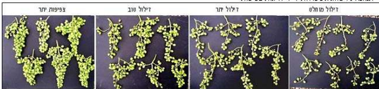
תמונה 1: סווג אשכולות ל-4 דרגות צפיפות

אופן הבציר ובדיקת מדדי האיכות: כשבוע לפני תחילת ההבשלה נערכה בדיקת סוכר וחומצה לקבלת תמונת מצב השוואתית בין הטיפולים, נדגמו כתפי אשכולות אקראיים ונבדקו 30 גרגרים שנבחרו אקראית מתוך הדגימה, הבדיקה בוצעה במעבדת הבקעה. הבציר בוצע ע"י מדדים מסחריים, בכל בציר נשקל היבול ונספרו האשכולות שנבצרו, משקל וקוטר הגרגר נמדדו במדגם אקראי של 30 גרגרים. מטרת הבדיקות בבציר היתה ללמוד על השפעות לוואי אפשריות של הטיפולים על היבול ואיכותו, בנוסף להשפעתם על תופעת התייבשות התפרחות ודילול היתר.