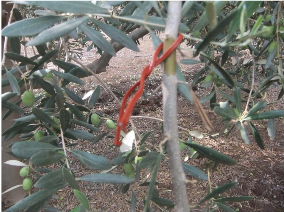
חוט סס של חברת אדמה אגן