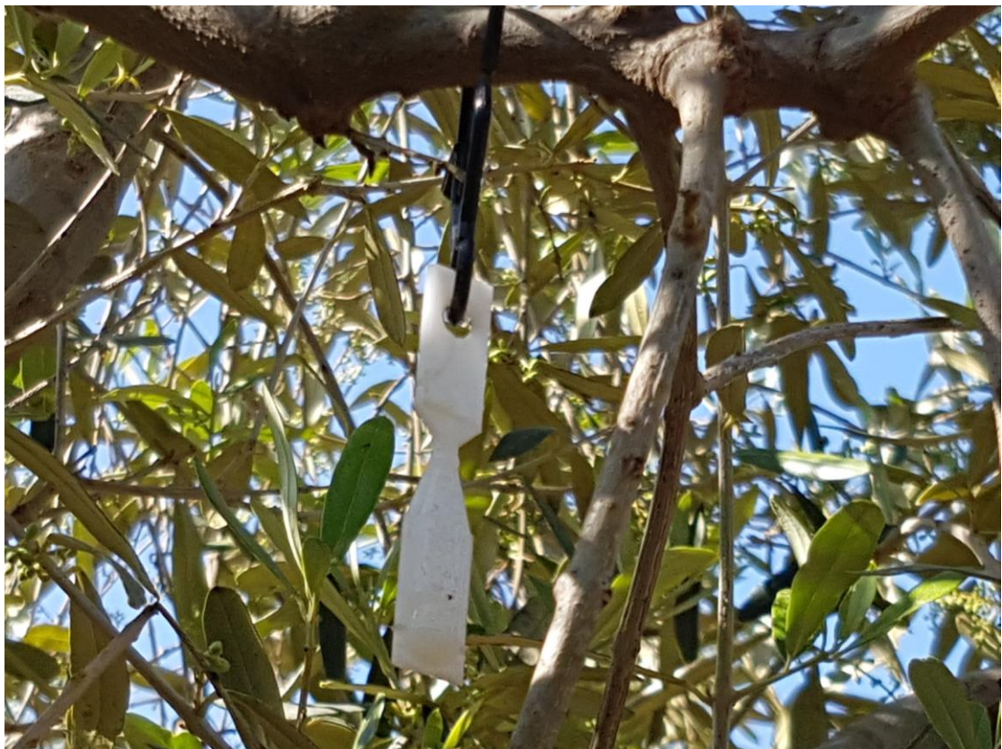
נדיפית רימילור סס הנמר של חברת רימי להגנת הצומח והסביבה