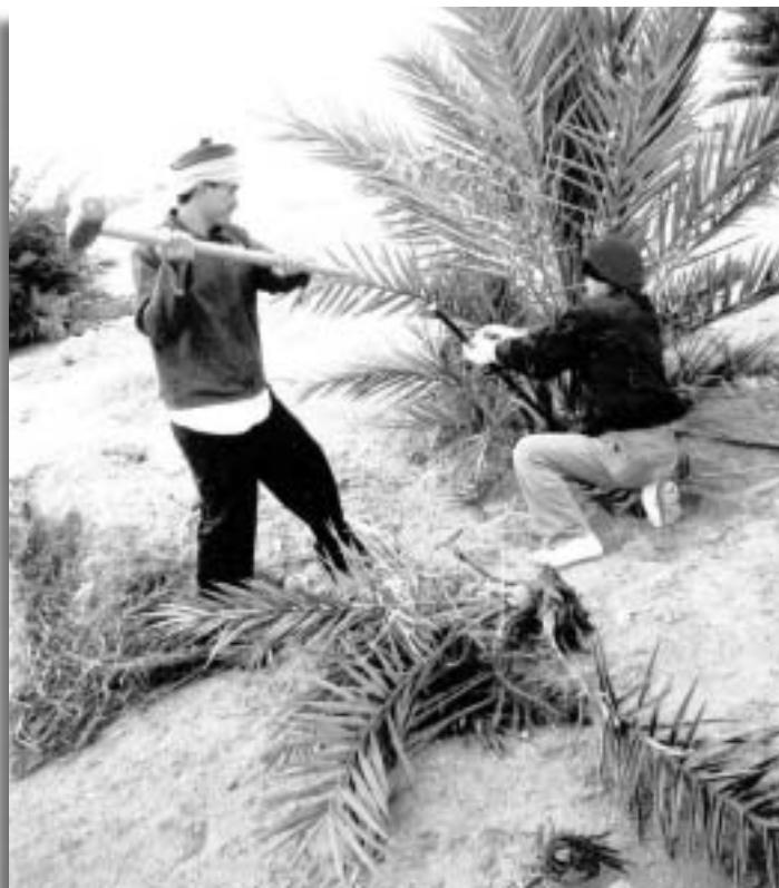
תמונה 1: ניתוק חוטרים מצמח האם בפטיש ואיזמל

למרות היתרונות הגלומים בריבוי תמרים בתרבות רקמה, התגלו לאחרונה עצים חריגים עם בעיות בחנטת הפרי, בהתפתחות העץ ובקצב צימוח איטי. עצים חריגים אלה שעורם גבוה - כ-30% משתילי התרבות שניטעו עד היום בארץ, והם גורמים לאיבוד זמן ולהפסד כספי רב (כהן וחוב, 2003, 2004). תופעות אלו נובעות כנראה משיבוש תהליכי התמיינות של הרקמה כתוצאה מטיפולים הורמונליים הניתנים בתרבות. לפיכך, חקלאים רבים נרתעים היום מנטיעת שתילים שמקורם בתרבות רקמה.