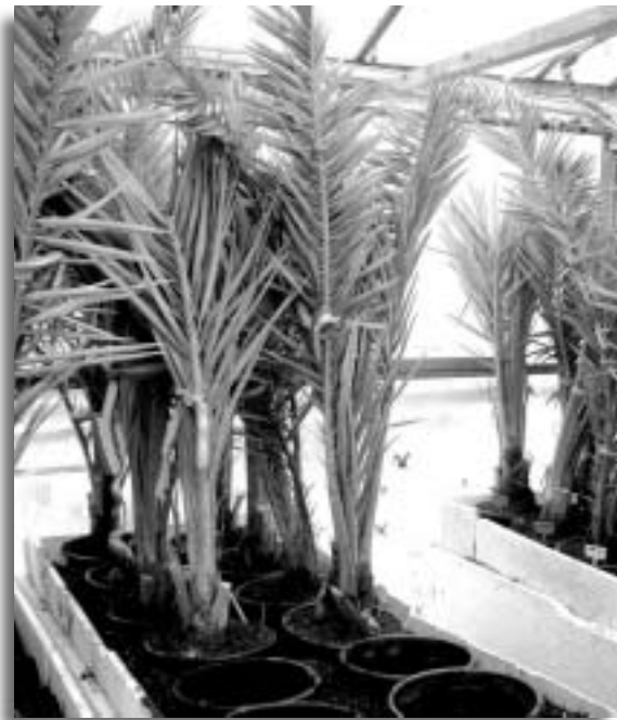
תמונה 2: ערוגות השרשה עם מצע מחומם

■ השרשת החוטרים בתנאים מבוקרים במשתלה: החוטרים הועברו בתנאי לחות למתקן ההשרשה שבמרכז וולקני. הם נשתלו בדליים בנפח 10 ליטר, פרט לניסוי קטורה, בו השתמשו בתחילה בכלים קטנים של 4 ליטר, ובהמשך הועתקו החוטרים לדליים בנפח 10 ליטר. החוטרים הוחזקו בערוגות מחוממות בטמפרטורה מבוקרת