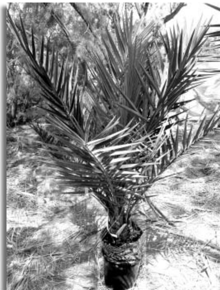
תמונה 5: מערכת השורשים בחוטר לפני נטיעה