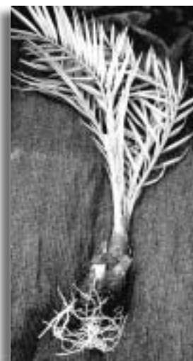
תמונה 3: חוטר תמר קטן מושרש

וקבועה (תמונה 2). הלחות נשמרה בעזרת ערפול קצוב במתזים. בניסוי סמר (2) השריית הלחות נעשתה באמצעות מערפלים (פוגרים) היוצרים ערפל "יבש" - טיפות מים דקות מאד, בקצב משתנה לפי שעות היום. משך ההשרשה בתנאי ערפול והקשיה היה כשבעה חודשים, לאחר שהם הועברו כל החוטרים להתבססות וגידול לשלושה-ארבעה חודשים נוספים בחממה, עד לצימוח עלים חדשים.