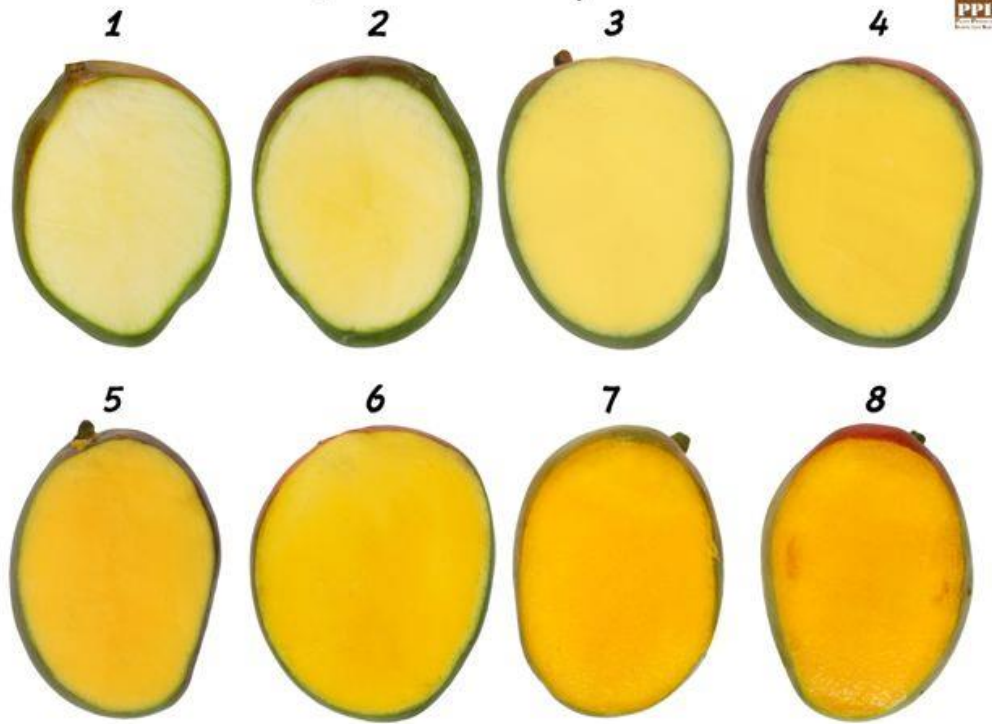
תמונות 3-7 ניתן לשיווק