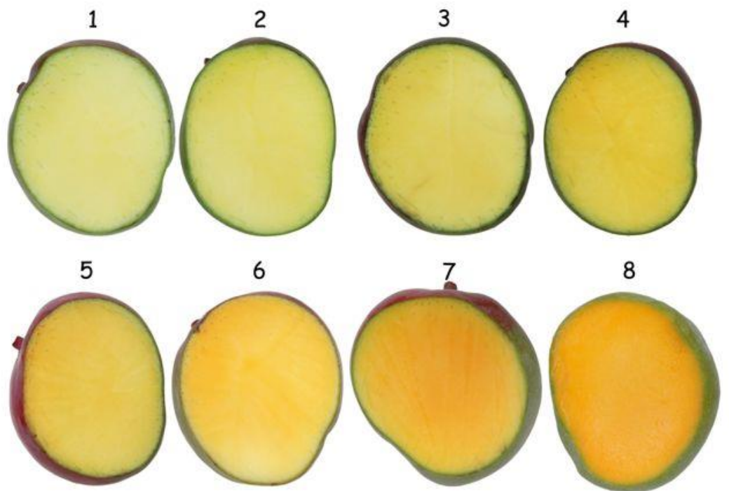
תמונות 3-7 ניתן לשיווק